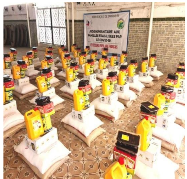
Disposition de l'aide alimentaire