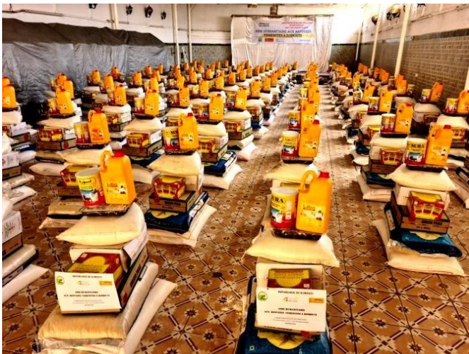
150 paniers alimentaires disponibles