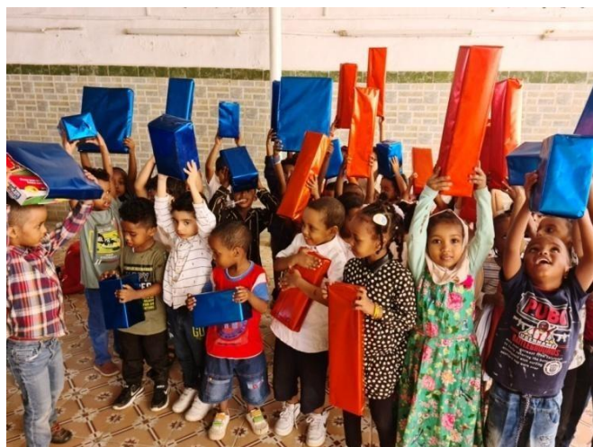
Distribution des cadeaux de Noël