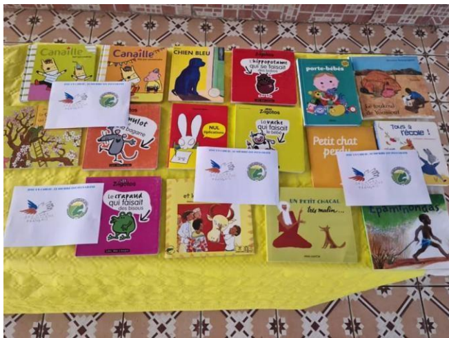
Livres pour aider les enfants à lire

A l'occasion de Noël, un cadeau pour un sourire pour la fête de la nouvelle année 2021, avec le concours financier du Secours Populaire Français. Fidele à ses engagements, le SPF a toujours aidé les enfants de Djibouti.