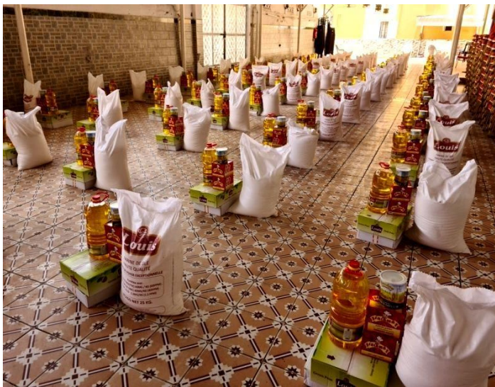
Un autre lot de distribution