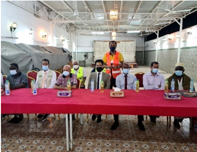
Les invités de marque

A l'occasion du mois de Ramadan et comme chaque année, l'ONG Bender Djedid se mobilise avec ses bénévoles pour apporter assistance à plusieurs centaines des familles nécessiteuses. Le chargé d'affaires de l'ambassade du Royaume d'Arabie Saoudite a honoré de sa présence ainsi d'autres personnalités et notamment les responsables de Bender Djedid, pour le lancement d'un lot de vivres à 50 familles Il s'agit des denrées alimentaires de première nécessité. Cette donation a été gracieusement offerte par l'ONG du Secours Islamique, basée à Djibouti.