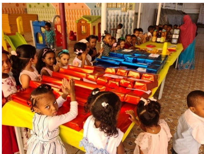
Cérémonie de distribution