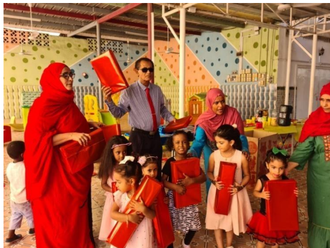
Les enfants de la maternelle de Bender Djedid