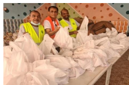
Distribution des carcasses des moutons