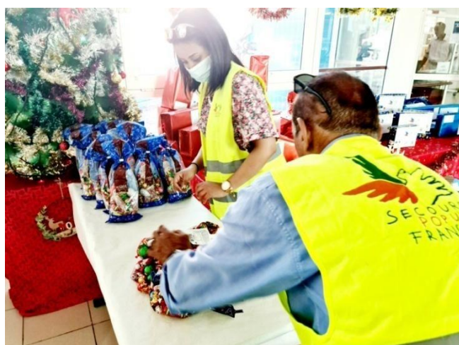
Fête à l'institut français de Djibouti