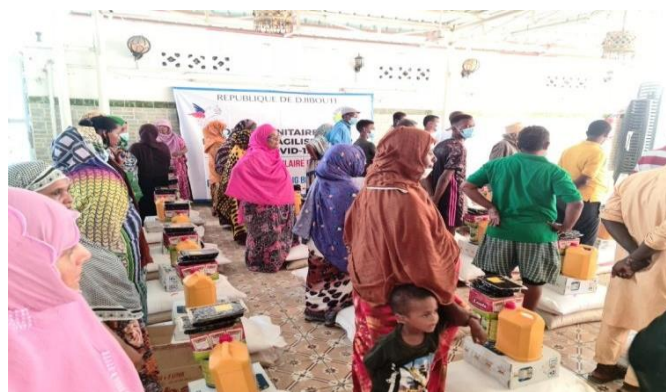
Les familles nécessiteuses