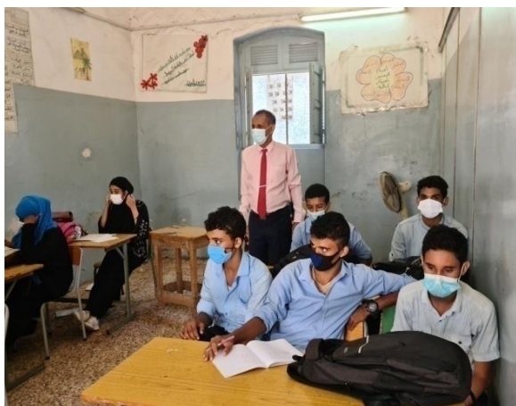
Les élèves de l'école Yéménite