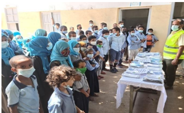
Les enfants de l'école yéménite

Le Secours Populaire Français, a financé la confection localement de masques, pour les enfants et les personnes en situation précaires. Selon les critères de précarité, 150 boursiers du Lycée français de Djibouti et 200 enfants réfugiés yéménites fréquentant l'école Al-Najahiya