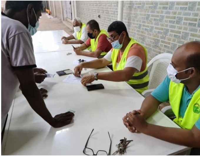
Les bénévoles en action

Servir et partager , un devoir que nous assumons pleinement pour rendre le sourire à ceux qui en ont besoin. Nous ne pouvons que remercier tous les donateurs et membres de notre ONG pour leur aide à rendre possible nos actions sur le terrain.