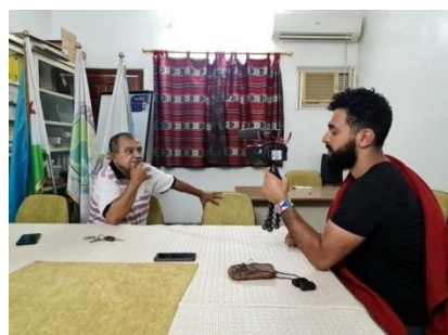
Interview du Vice-Président