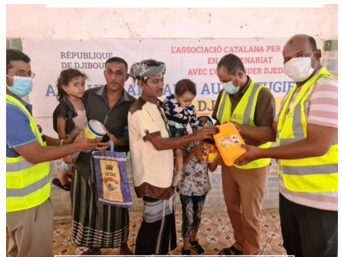
Lancement de l'aide