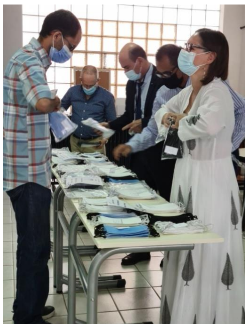
Figure 1 Distribution des masques aux boursiers