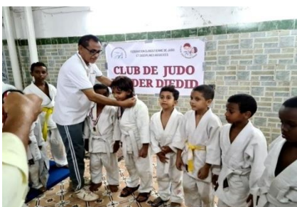
Club de Judo de Bender Djedid