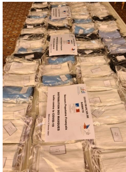
La phase de préparation