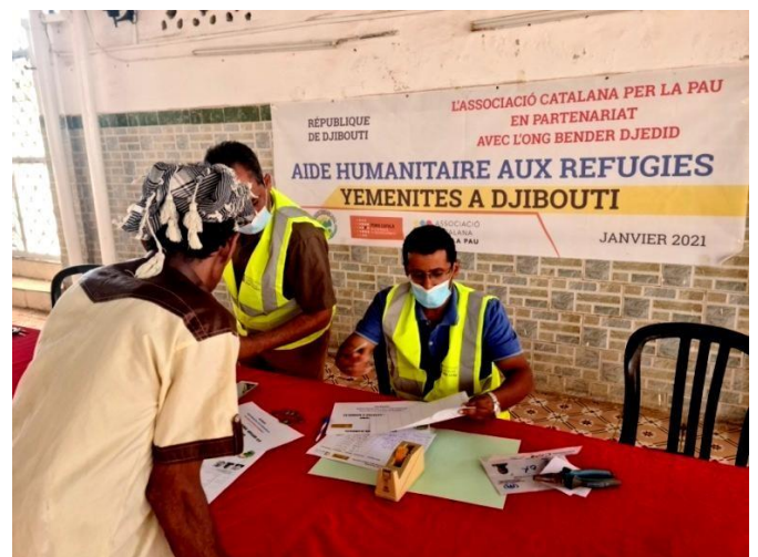
Identification des familles