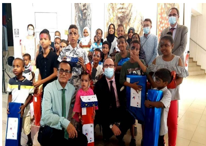
Cadeaux de Noël aux enfants boursiers