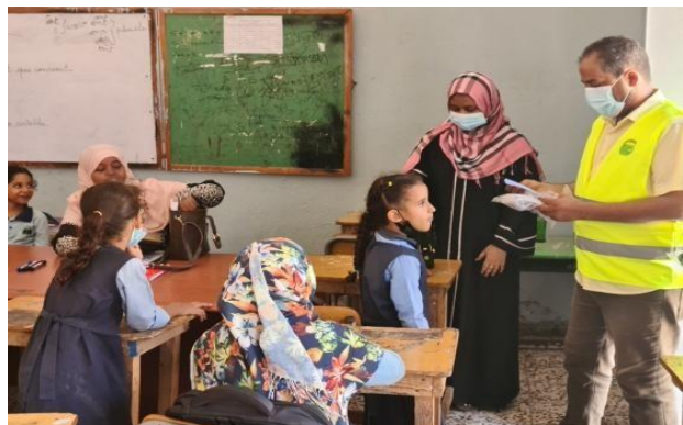
L'identification de enfants par le bénévole