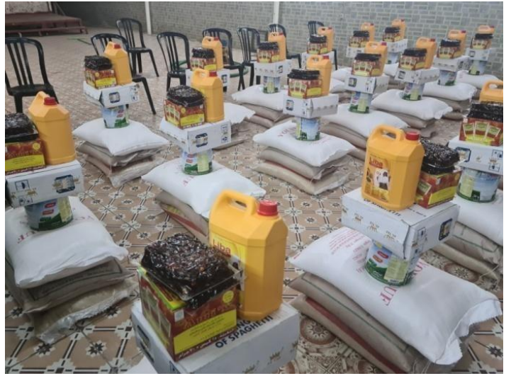
Préparation du lot