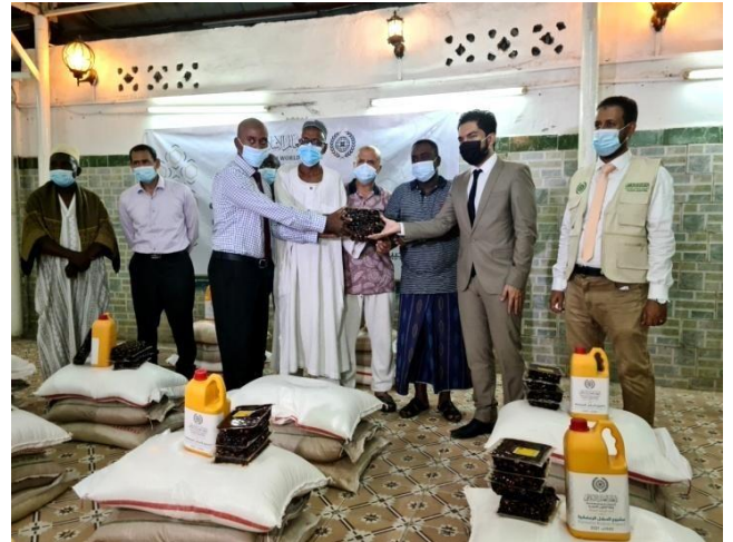
Lancement de l'opération par le chargé d'affaire de l'Arabie Saoudite