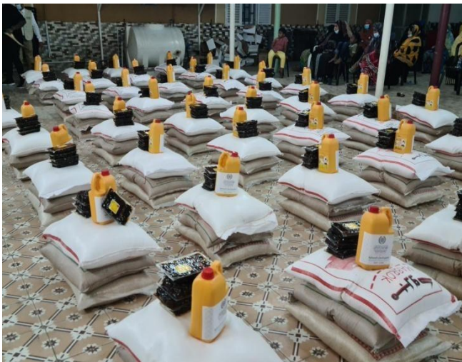
Mise en place de panier alimentaire