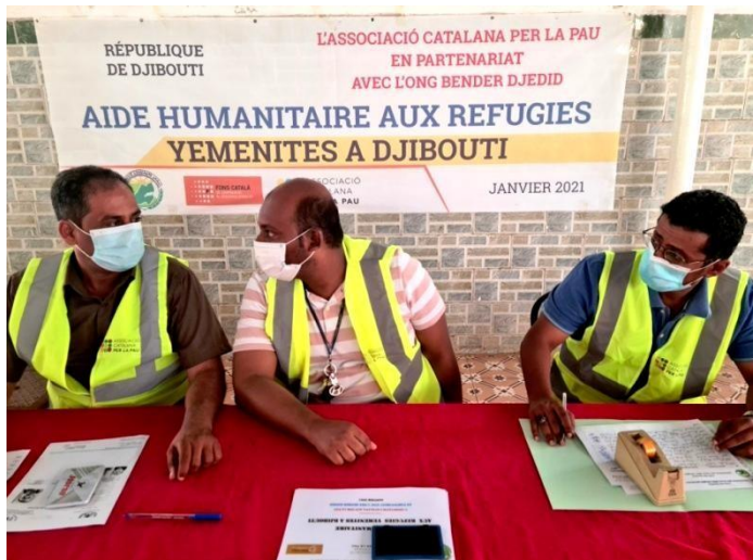
Les bénévoles en préparation pour accueillir