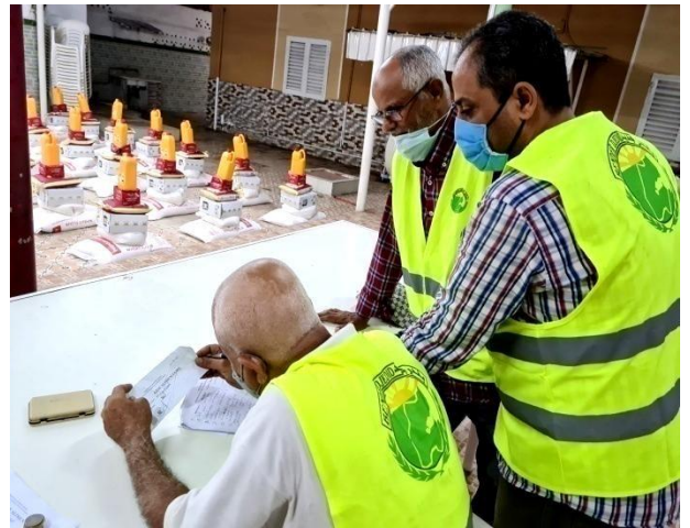
Les bénévoles de l'ONG