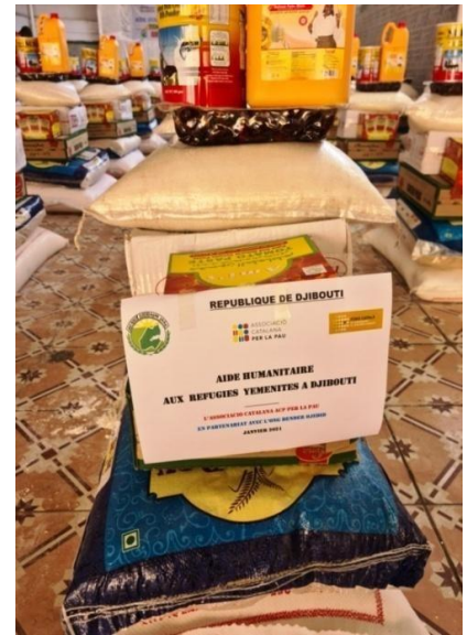
Composition de l'aide