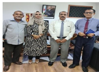
Prise de contact avec madame la ministre