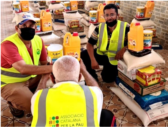
Les bénévoles en phase de vérifications