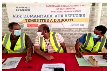
Les bénévoles en plein préparation