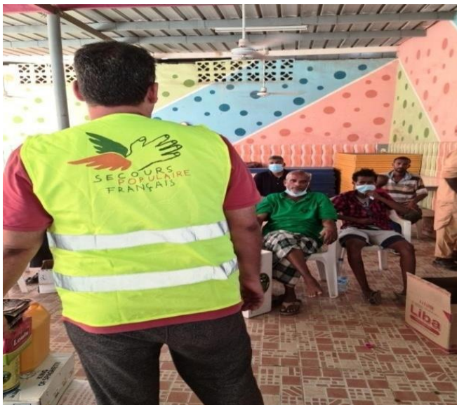
Bénévoles au cœur de l'action