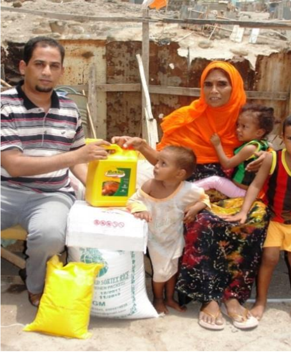
تقديم مساعدة لأسرة في حيابله