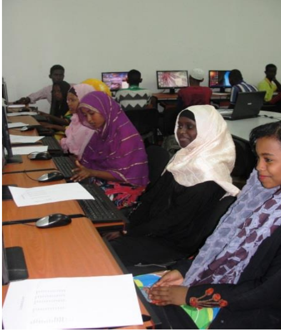
شباب تحت التكوين بدخل

انهى 110 شابا بدخل التكوين بالبرنامج المعروف بـ الفضاء الرقمي العام بنجاح، و هذه الدفعة تتكون من 65 فتاة و 45 فتي، و الجدير بالذكر أن هؤلاء أنهوا التكوين منذ ستة أشهر مضت، مع العلم أن الدفعة الثانية لعام 2013 تبدأ دراستها في شهر أكتوبر من نفس العام.