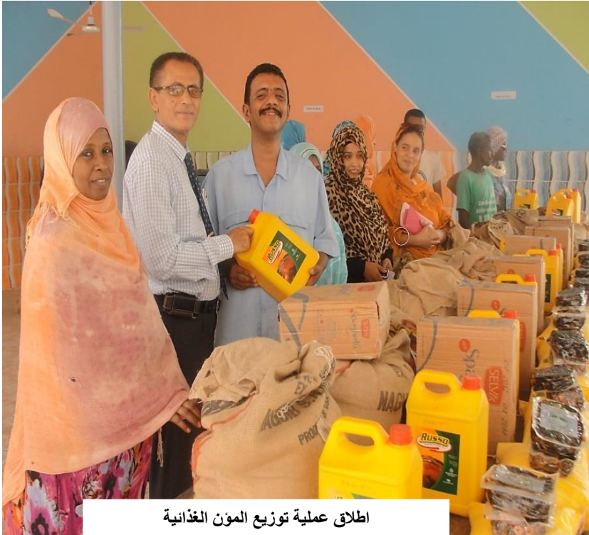
اطلاق عملية توزيع المون الغذائية

في إطار المساعدات الخيرية و الإنسانية و بمناسبة حلول شهر رمضان في كل عام، فان منظمة بندر جديد تبدأ بتوزيع المون الغذائية خصوصا في هذا الشهر المبارك و تشمل هذه المساعدات 750 أسرة يتم توزيع المون الغذائية عليها بثلاث مراحل، كل مرحلة تشمل 250 أسرة و تتكون المساعدات الغذائية من الأرز و المكرونة و السكر و الزيت. و إذ تميل المنظمة إلى هذا التضامن فإنه ليس بغريب عليها ، لأنه من المعروف عنها و منذ تأسيسها أنها كانت تسعى جاهدة لصالح رغد العيش و مد يد العون للأسر المتعسرة، و يشهد هذا الفعل أيضا التزام المنظمة الدؤوب بالأعمال الخيرية لتخفيف و وطأة الفقر على الحالات