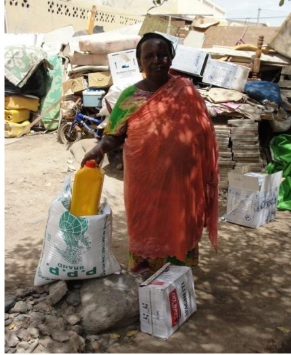
مساعدة لأسرة بدون مأوى